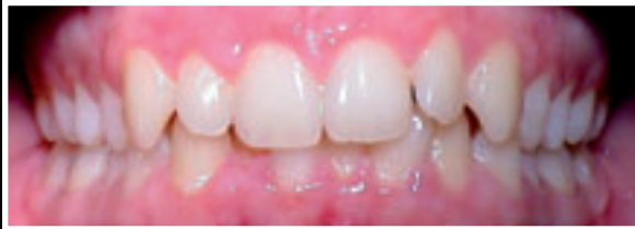
Deckbiss mit kaum sichtbaren unteren Frontzähnen.