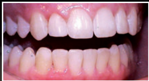
Nach Denticuring und Aufbau der hypoplastischen Anteile