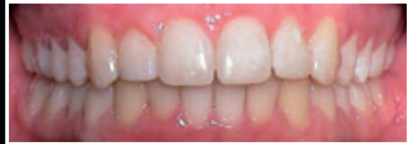
Untere Frontzähne sind deutlicher sichtbar.

Hypoplastische Eckzähne mit eingezogener vorderer Kante wirken sehr unvorteilhaft. Auch die seitlichen Frontzähne sind im Verhältnis zu den großen mittleren unproportional klein.